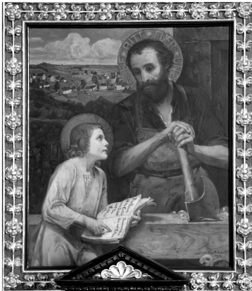
Bild: Josefsaltar in Auw

Sei begrüßt, du Beschützer des Erlösers und Bräutigam der Jungfrau Maria. Dir hat Gott seinen Sohn anvertraut, auf dich setzte Maria ihr Vertrauen, bei dir ist Christus zum Mann herangewachsen. O heiliger Josef, erweise dich auch uns als Vater, und führe uns auf unserem Lebensweg. Erwirke uns Gnade, Barmherzigkeit und Mut, und beschütze uns vor allem Bösen. Amen.